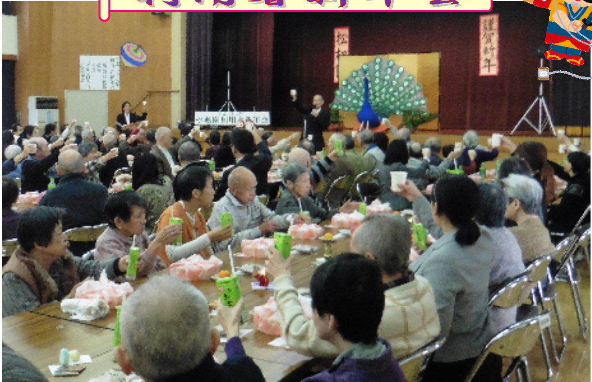
平成29年1月12日、松楓会ホールにて、新年の初顔合わせとなる「利用者新年会」を開催し、新しい年を迎えた喜びを利用者の皆さんと職員一緒にお祝いました。