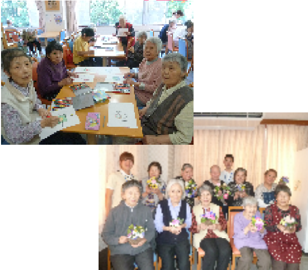
老 行 が 行 お す