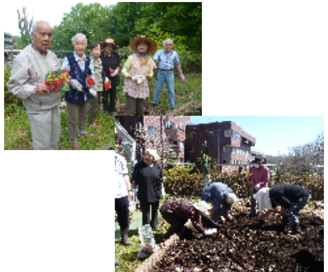
園 が す 園 す