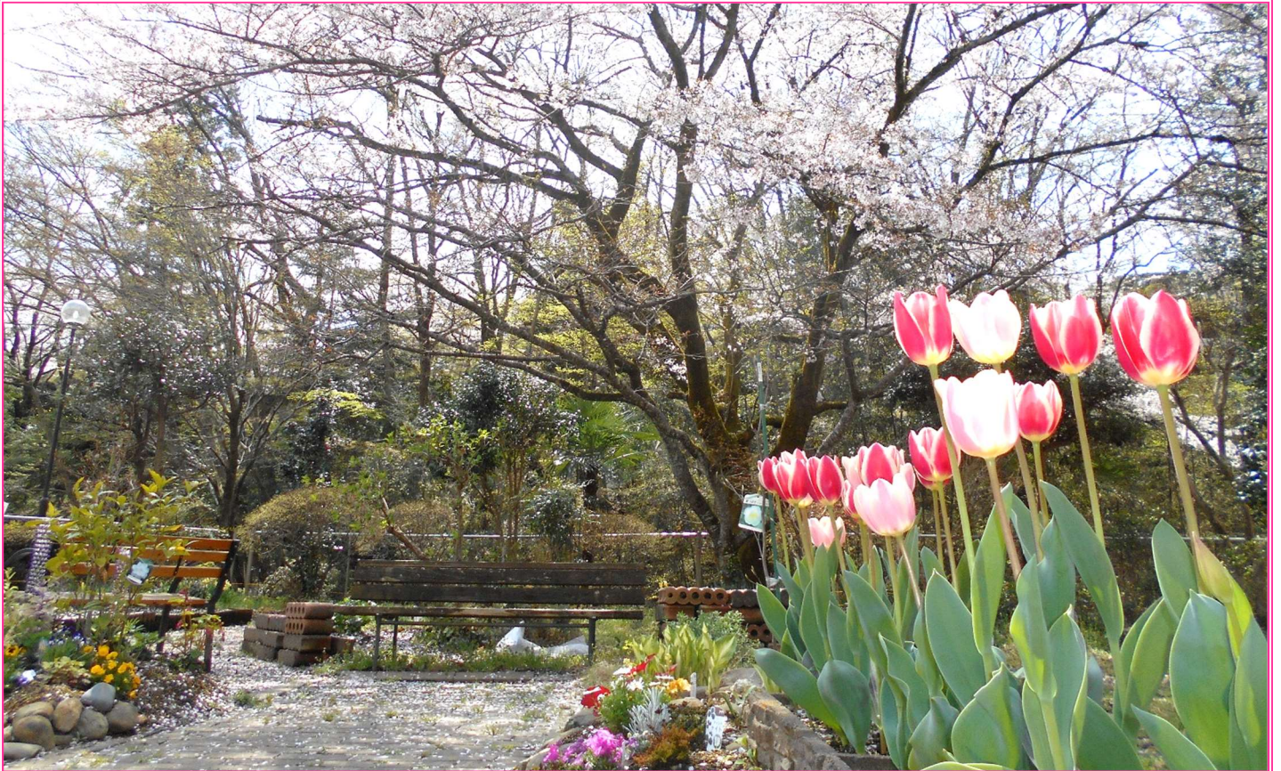
令和5年3月28日 撮影 園庭の桜とチューリップ

新緑の輝く季節となりました。 先月、三月二十四日の役員会にて、令和五年度の事業計画及び予算が承認されました。